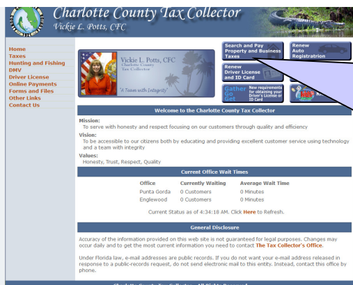
ECRAN D'ACCUEIL du service des taxes de PORT CHARLOTTE

Avec votre navigateur, aller sur la page d'accueil du service des taxes : http://www.ctaxcol.com/